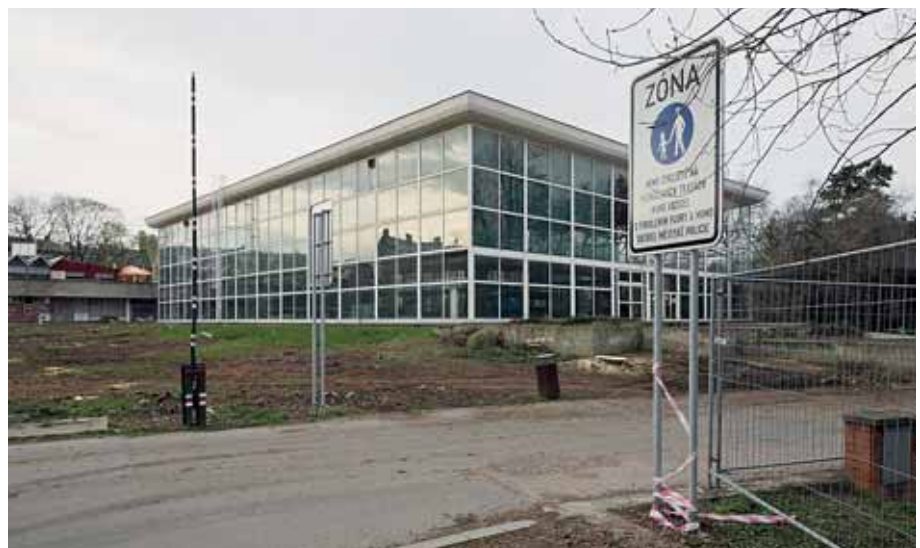
Současný stav pavilonu a okolí bez vykácených dřevin.

Nová správní budova sestává ze dvou samostatných částí. Nižší část je podsklepená budova restaurace se dvěma nadzemními podlažími. Restaurace bude mít celkem 90 míst ve dvou podlažích.