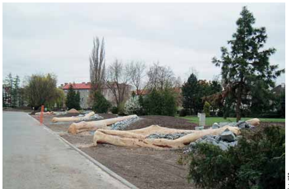
Bývalá fontánková alej se změní i díky soutěži Lipová ratolest.

těžící a pokusí se vdechnout náročnému a nevěděnímu projektu život. Vzhledem k tomu, že fontánková alej se nachází v těsné blízkosti zčásti rekonstruované Rudolfovy aleje, vznikne ve Smetanových sadech zahradní úprava, která bezesporu přispěje k celkové obnově parku. „Věřím, že občané Olomouce, města s bohatou zahradnickou tradicí, zavítají ve dnech 4. až 6. května do Smetanových sadů a svým zájmem povzbudí a podpoří všechny soutěžící,“ dodává Naďa Krejčí. (nk)