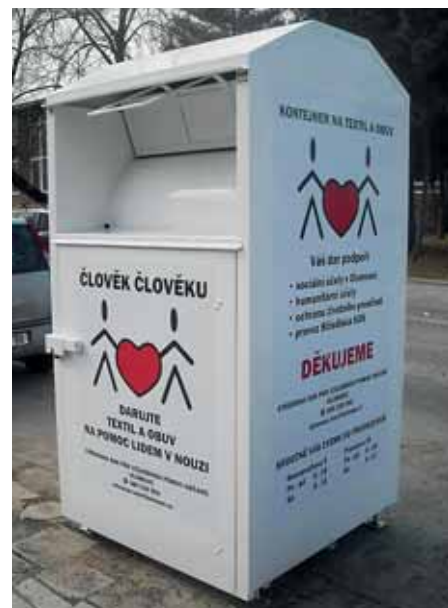
Takto vypadá kontejner Střediska SOS.