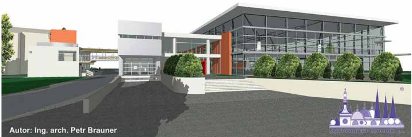
Autor: Ing. arch. Petr Brauner

Další z budoucích pohledů na opravený pavilon A.