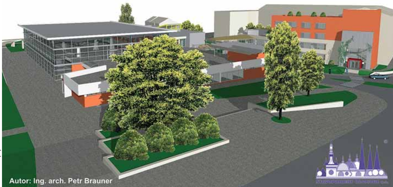
Autor: Ing. arch. Petr Brauner

V rámci rekonstrukce z dnešní stavby, kterou v roce 1965 projektoval renomovaný architekt Petr Brauner, zůstane prakticky