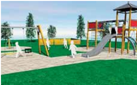
Vizualizace Onyx wood

Záměrem města je v každé čtvrti nabídnout nejméně jedno kvalitní hřiště. Celkem je pro letošek vyčleněno 5 milionů korun. Na některé lokality se letos nedostane, v příštích letech je však plánována stavba či rekonstrukce hřišť například v Lošově, Novém Světě, Nové Ulici, na jihu Nových Sadů, v Chomoutově či v areálu ZŠ Demlova. Mimo to se nyní chystají práce na hřišti u zoo na Svatém Kopečku a u vstupu do Výpadu, připravené už z loňska. Nabízíme přehled hřišť, která jsou na pořadu letos.