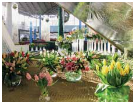
Pavilon A na výstavišti Flora nabídne opět záplavu květin.